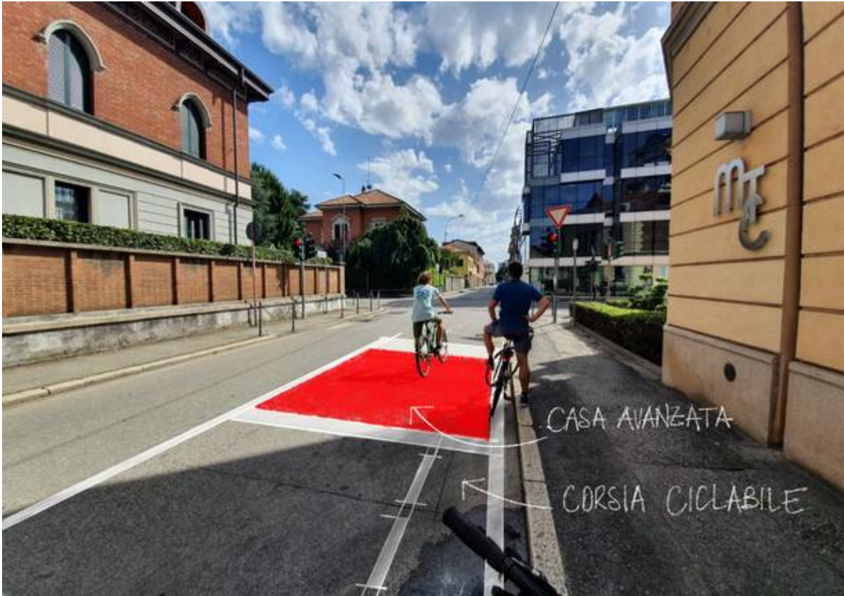
Un render della “casa avanzata” ipotizzata in corso Sempione

Qui trovate il documento completo sul progetto rete ciclabile d'emergenza e ciclabilità a Gallarate.