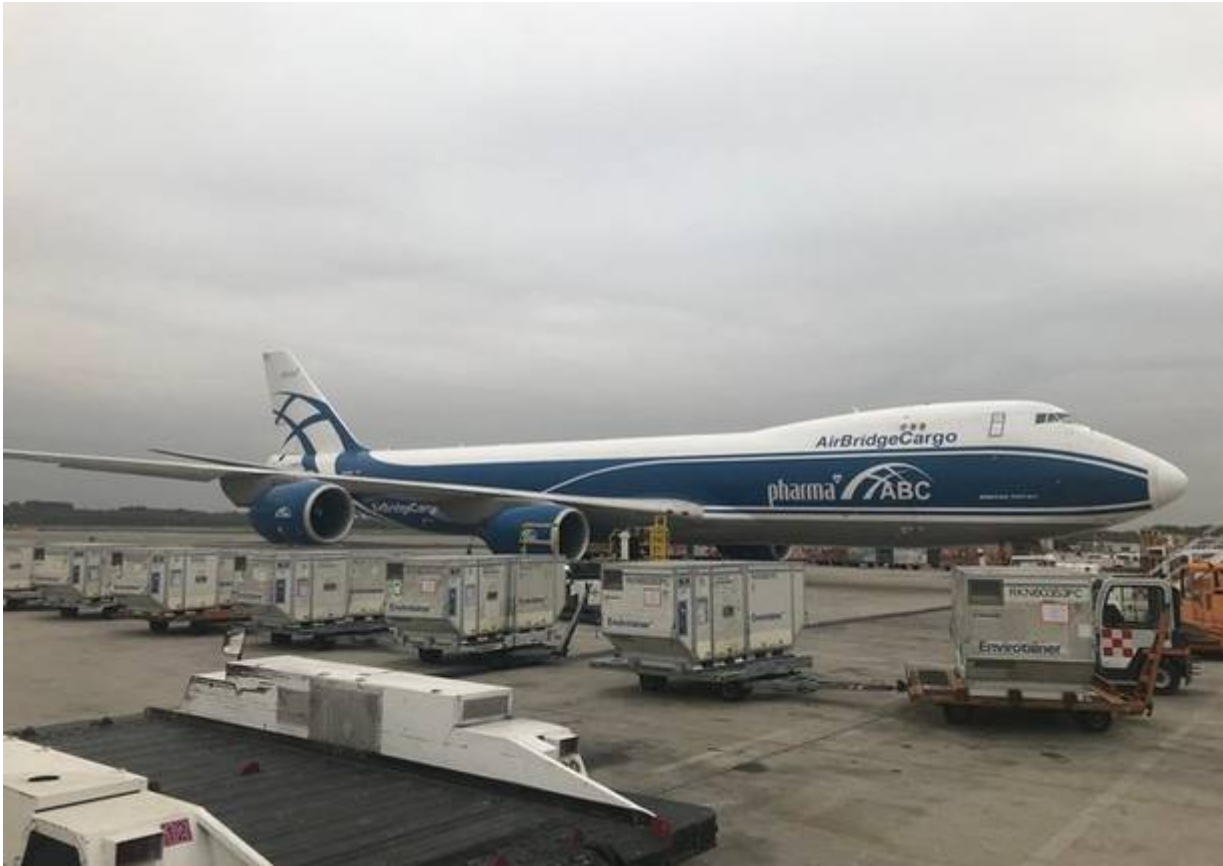
Una spedizione di vaccini da Malpensa verso la Cina con il vettore specializzato PharmaABC

La logistica del cargo di Malpensa è già specializzata nel farmaceutico e anche nel trattamento specifico di vaccini, con esportazioni verso la Cina (un enorme carico era partito lo scorso anno) o il Sudamerica (l'ultimo carico per il Brasile, con vaccini contro la meningite trasportati da Cargolux).