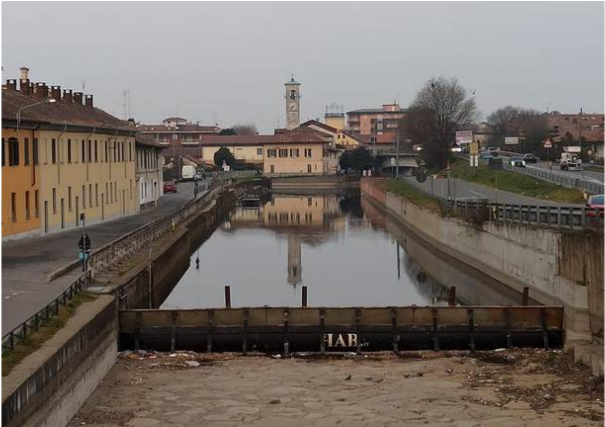
La regolazione con traverse

La situazione però rimane critica, per l'agricoltura. “Considerando che da quasi ottant'anni non si era mai registrato un periodo siccitoso così grave , appare evidente come i provvedimenti che si stanno assumendo nel tentativo di sostenere le aziende agricole in difficoltà rappresentino tutto quanto è possibile attuare in un simile scenario. Le attuali riserve idriche possono garantire solo un primo turno irriguo e nemmeno a pieno regime ; se non avranno luogo a breve adeguate precipitazioni in grado di incrementare i livelli idrici, l'acqua invasata nei grandi laghi si esaurirà entro una ventina di giorni al massimo”.