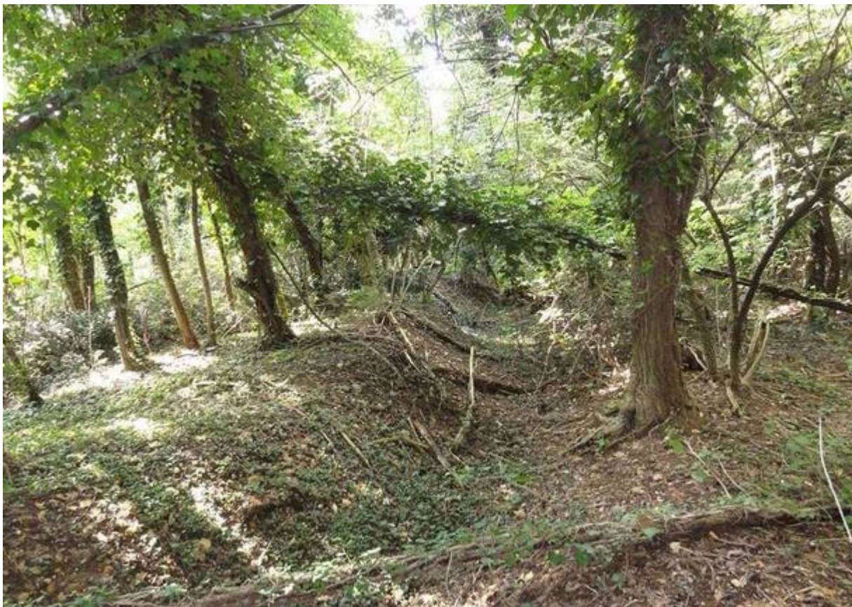
Trincee nel bosco di Robecchetto.