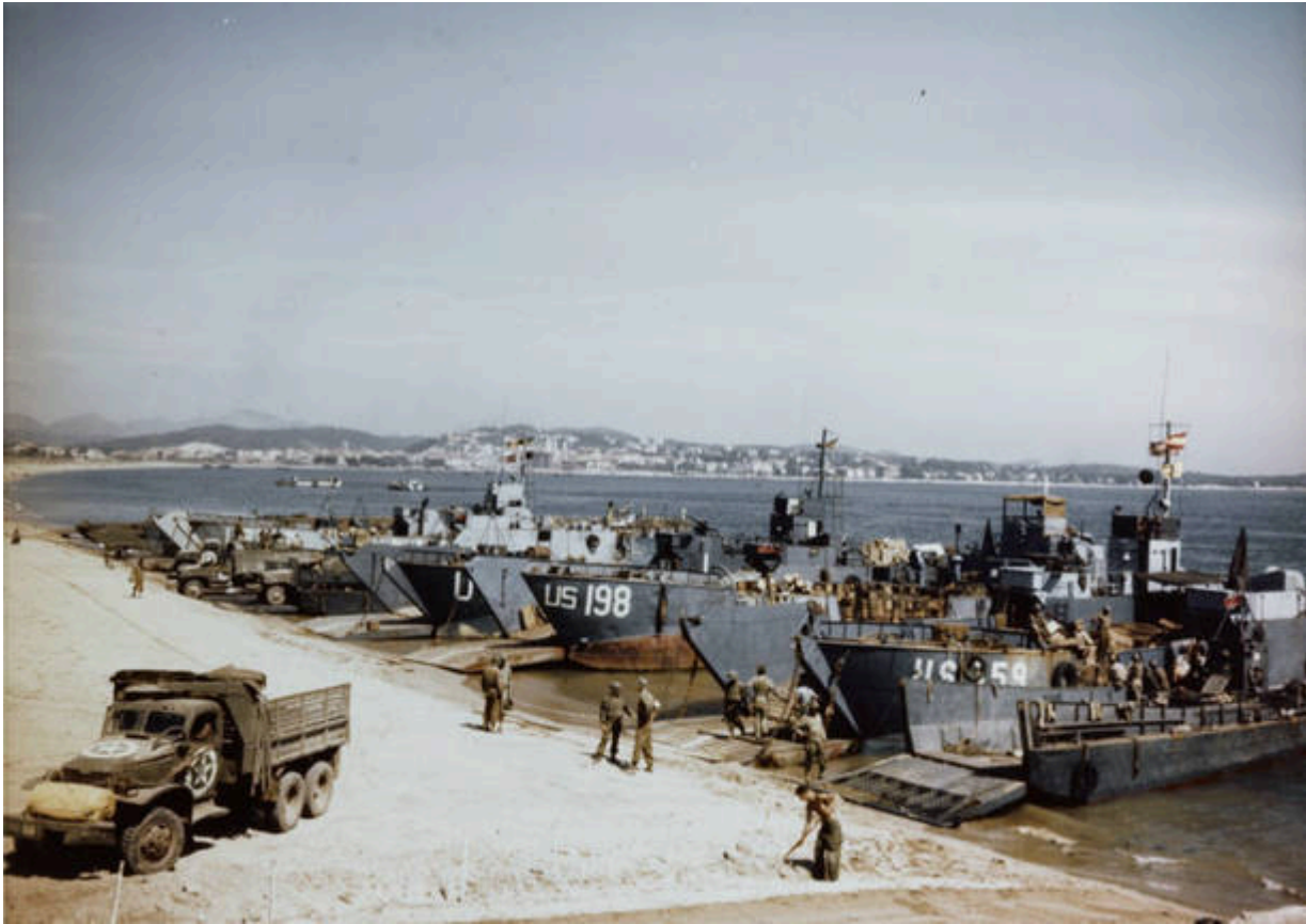
Mezzi da sbarco americani sulla spiaggia di Saint Raphael, 20 agosto 1944

Al comando del generale Hans Schlemmer , tra le Alpi e la pianura arrivarono in zona ben 40mila soldati , spostati dalla costa tra Liguria e alta Toscana, dove da sette mesi attendevano un eventuale sbarco che non ci fu mai. L'operazione di rischiaramento fu chiamata “Kunstliche Nebel” , vale a dire nebbia artificiale .