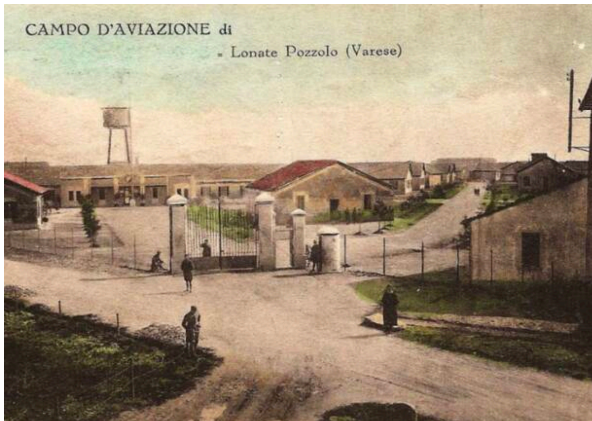
Ingresso del campo di Lonate Pozzolo in una foto cartolina a colori dell'inizio degli anni'20

This entry was posted on Monday, March 27th, 2023 at 11:17 am and is filed under Aeroporto . You can follow any responses to this entry through the Comments (RSS) feed. You can leave a response, or trackback from your own site.