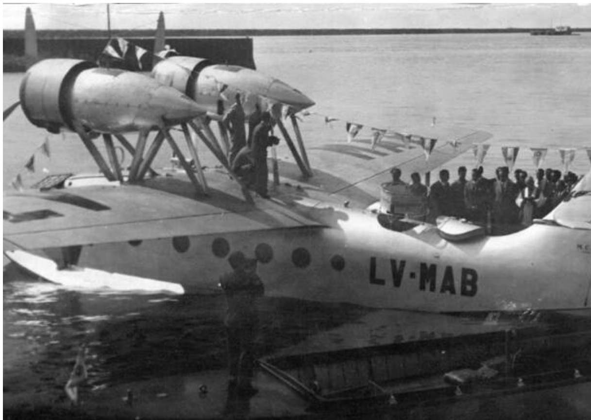
Uno dei tre M.C.94 finiti in Argentina, originariamente marcato I-LATO