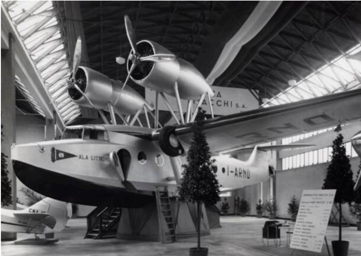
Un M.C.94 alla fiera campionaria di Milano del 1935