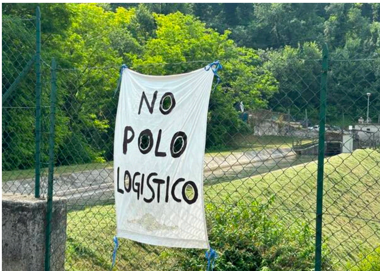
Protesta contro nuovi poli logistici nella zona delle colline tra Brescia e Mantova

Infatti, oltre la metà (il 52%) del consumo di suolo dell'intera regione si colloca nelle tre province , con Brescia che primeggia con il suo dato di 137 ettari di campi agricoli trasformati in capannoni e strade, nel solo 2023. Il rischio è che tra Milano e Brescia, un pezzo per volta, si vada a configurare un unico, grande nastro formato da piastre logistiche e industriali, spodestando l'attività agricola e la ricchezza di ambienti naturali e risorgive.